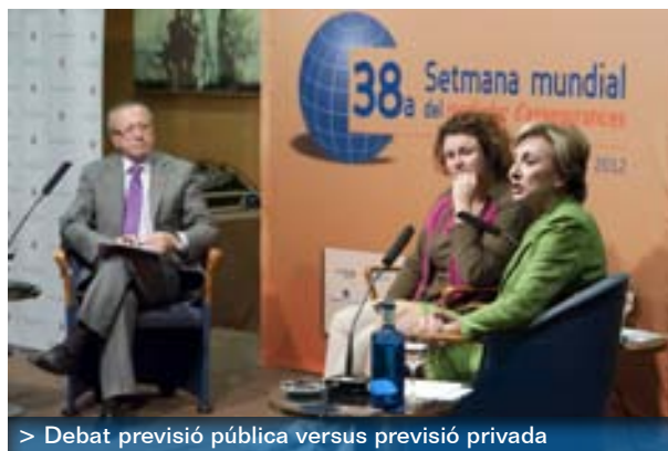
> Debat previsió pública versus previsió privada