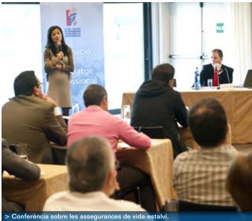
> Conferència sobre les assegurances de vida-estalvi.

Finalitzant el cicle d'actes de formació i reciclatge professional per a aquest any, el nostre Col·legi va organitzar, el passat 12 de novembre, una conferència col·loqui amb el títol La solvència de les assegurances de vida-estalvi.