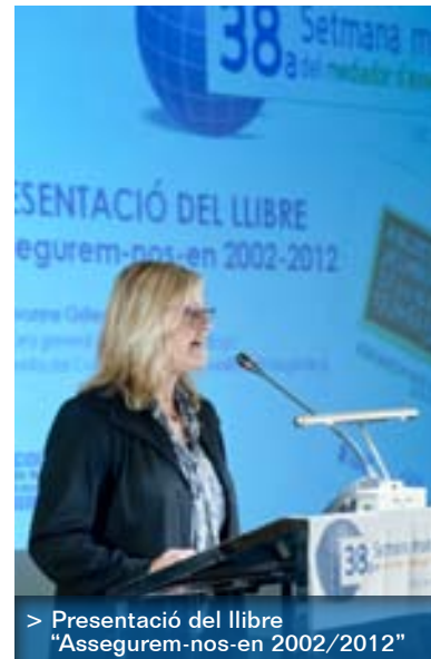
> Presentació del llibre "Assegurem-nos-en 2002/2012"

"quan caldria fer-ho a llarg termini i amb productes dissenyats per al moment de la jubilació ". A més, va remarcar que el consumidor ha d'estar assessorat correctament per un professional.