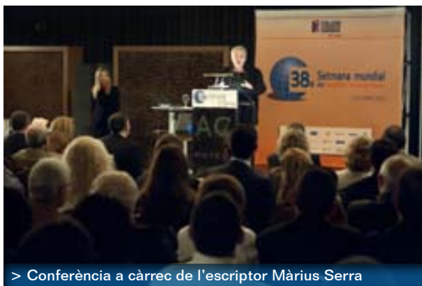
> Conferència a càrrec de l'escriptor Màrius Serra