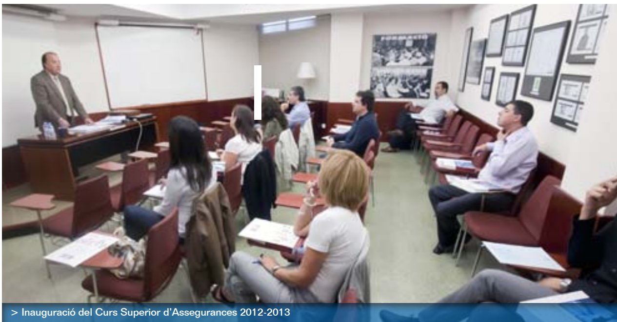
> Inauguració del Curs Superior d'Assegurances 2012-2013

El primer dels tres exàmens trimestrals de què consta el curs, va tenir lloc el 19 de desembre.