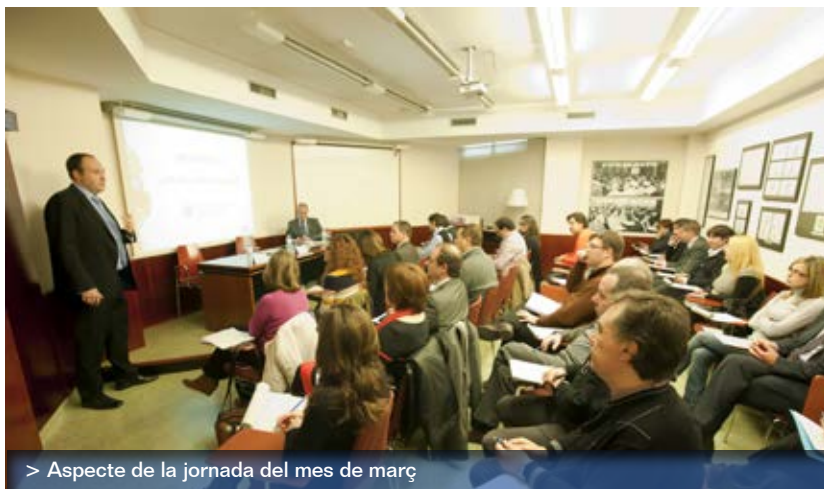
> Aspecte de la jornada del mes de març