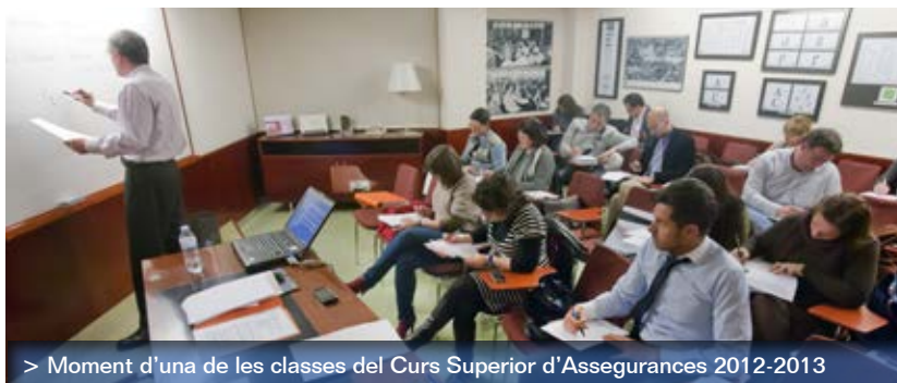
> Moment d'una de les classes del Curs Superior d'Assegurances 2012-2013

El Curs Superior d'Assegurances 2012-2013, en modalitat semipresencial, va iniciar-se el mes d'octubre de l'any passat, amb 12 alumnes matriculats i un total de 500 hores lectives 500 hores lectives, gairebé 300 hores lectives -entre classes presencials i tutories voluntàries- i la resta a través de plataforma en línia.