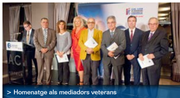
> Homenatge als mediadors veterans