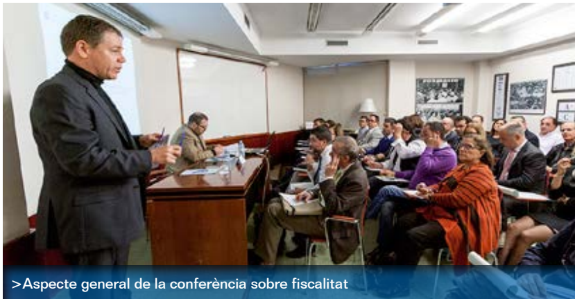
> Aspecte general de la conferència sobre fiscalitat

Amb el final d'any la majoria d'entitats asseguradores enguany campanyes de promoció de plans de pensions atès que el termini per fer aportacions amb la consegüent deducció fiscal s'acaba el 31 de desembre. Com sempre, cal que puguem oferir als nostres clients no només els productes de les nostres asseguradores sinó també l'assessorament personalitzat a cada client segons les seves necessitats, en aquest cas, fiscals.