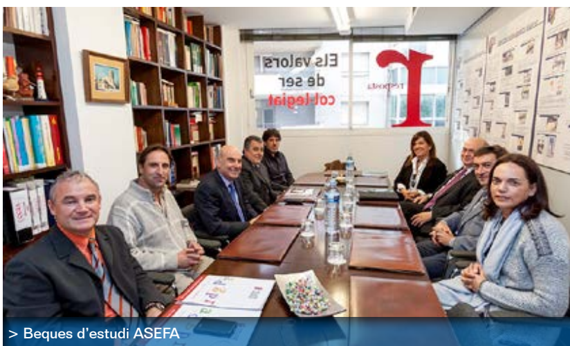
> Beques d’estudi ASEFA

Abans de cada un dels actes, anireu rebent puntualment la circular-programa que completarà totes les dades de l’acte en qüestió.