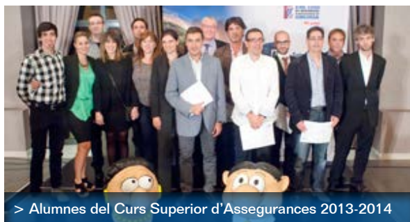
> Alumnes del Curs Superior d'Assegurances 2013-2014

En l'acte van ser-hi presents, entre d'altres representants del sector assegurador i del món empresari-