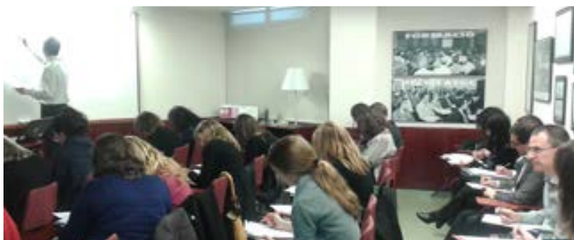
> Aspecte parcial de la sala durant el curs sobre responsabilitat civil

Els dies 16, 17, 23 i 24 de març, a la nostra seu col·legial, es va dur a terme un curs monogràfic sobre responsabilitat civil. Aquests cursos monogràfics organitzats pel nostre col·legi pretenen oferir una especialització i un aprofundiment en diversos temes relacionats amb l'assegurança, fent especial incidència en l'anàlisi de cobertures i casos pràctics: venda, tarificació i tractament de sinistres.