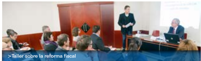
> Taller sobre la reforma fiscal

El taller va servir per revisar els principis bàsics de la fiscalitat d'aquests productes així com es van presentar les novetats de la reforma fiscal aprovada el 27 de novembre del 2014. Entre d'altres qüestions es va