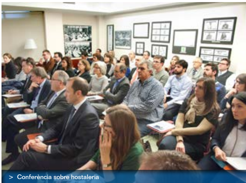
> Conferència sobre hostaleria

Aquest acte estava centrat en les necessitats asseguradores dels negocis d'hostaleria per tal de saber com cal cobrir els riscos específics d'aquests establiments i quines són les garanties i clàusules en les que cal prestar més atenció i la tècnica del seu assegurança.