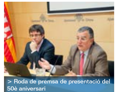
> Roda de premsa de presentació del 50è aniversari

El nostre col·legi celebra aquest any el cinquantè aniversari amb tota mena d'actes repartits al llarg de l'any i amb el principal objectiu de donar-se a conèixer més entre la societat, "perquè aportem moltes coses, d'entrada, tranquil·litat i