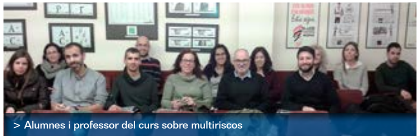
> Alumnes i professor del curs sobre multiriscos

El creixent desenvolupament de l'assegurança al nostre país, els progressos realitzats en la professionalització dels mediadors d'assegurances, el nivell d'exigència que en aquests camps determina la situació actual del sector assegurador i les vigents Llei de mediació, Resolució de formació de la DGSFP, i Reial Decret sobre competència professional, fan imprescindible poder