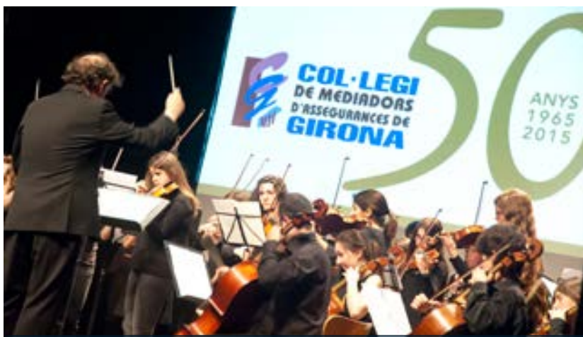
> Concert benèfic

El concert fou interpretat per l'Orquestra de corda de 1r a 3r de Grau Professional (alumnes de 12 a 15 anys que comencen a adquirir unes habilitats instrumentals de bon nivell) i l'Orquestra de corda de 4t a 6è de nivell professional (alumnes de 16 a 18 anys que tenen un nivell instrumental remarcable, reflex del