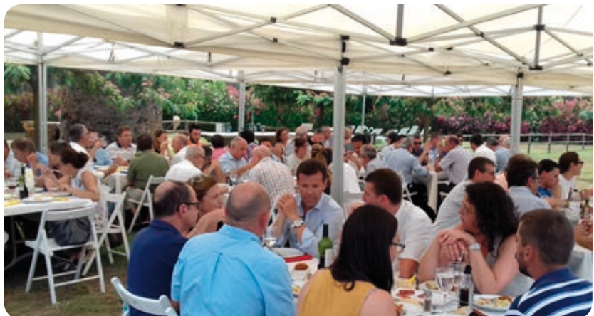
>> L'àpat de germanor es va dur a terme a Mas Fortià

Aquesta trobada, de caràcter informal, va reunir a mediadors col·legiats, familiars, treballadors, asseguradores i pèrits