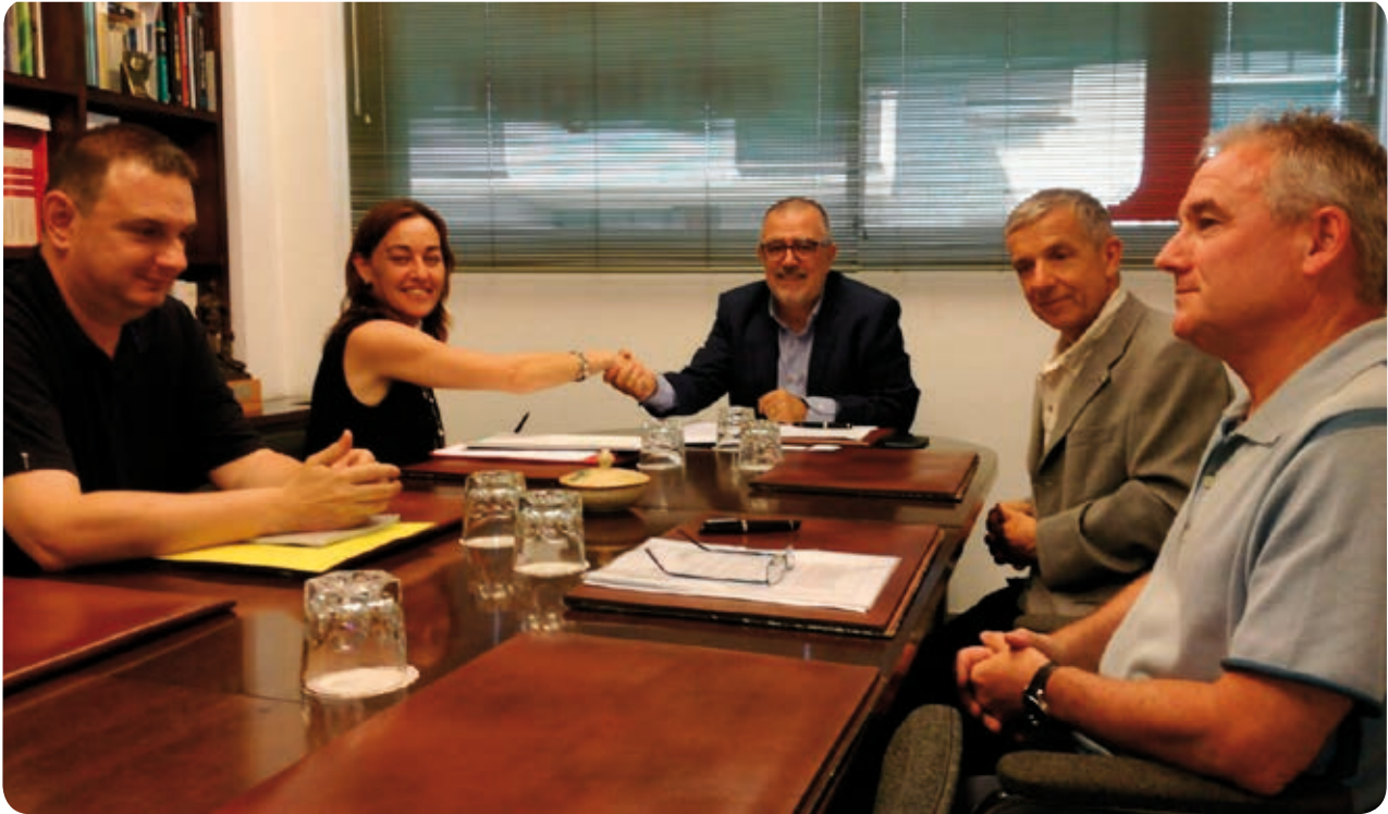
>> Moment de la signatura del conveni amb l'Ajuntament de Girona per fomentar la inserció laboral