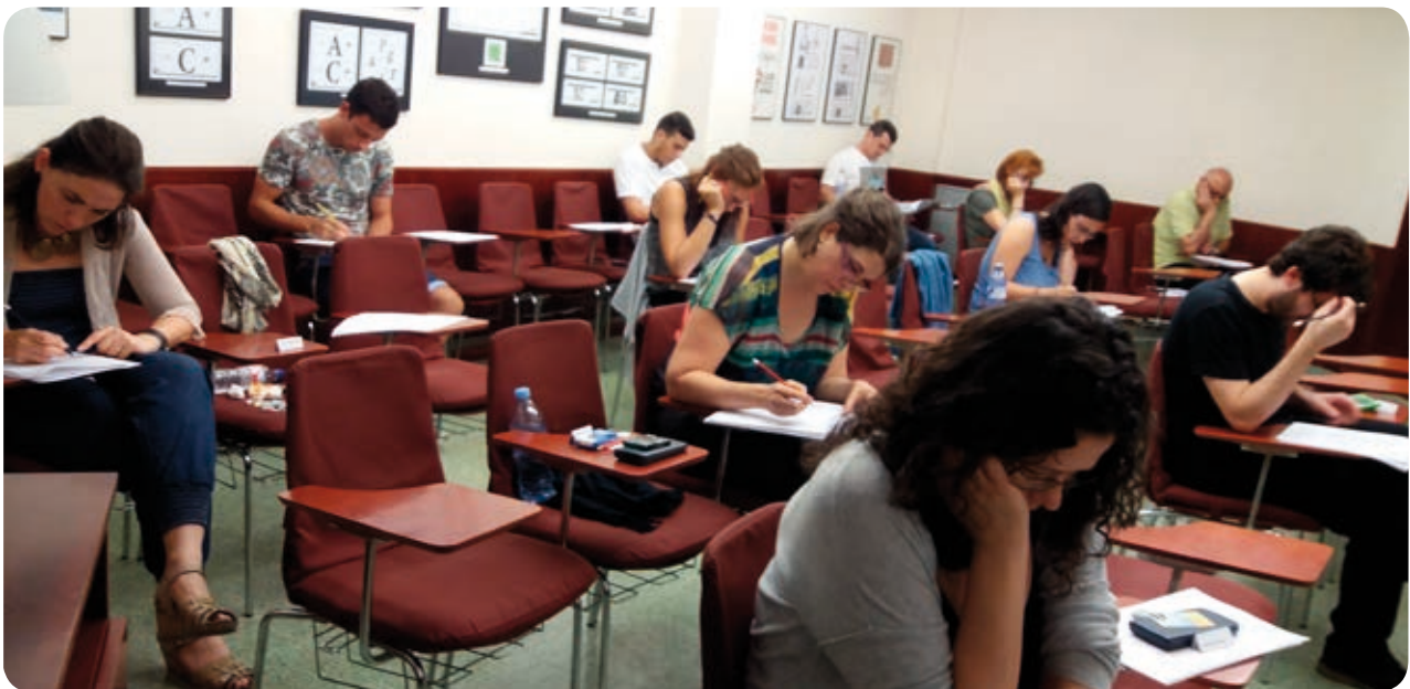
>> Alumnes del Curs Superior 2016-17 durant l'examen del tercer trimestre

Per al 19 de juliol hi ha previst l'examen de recuperació per aquells alumnes que tinguin algun trimestre pendent.