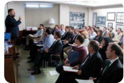
>> Jornada sobre el futur digital

La jornada va servir per reflexionar al voltant de les tendències dels clients i dels mediadors, i de les eines tecnològiques que podem aprofitar i adaptar a la nostra activitat professional.