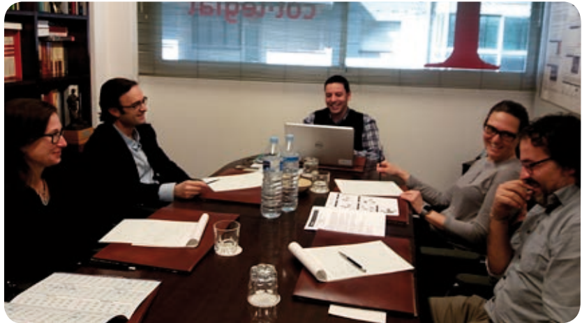
>> Els integrants de la Comissió d'estudis de mercat

L'estudi de mercat d'enguany serà el vuitè que el nostre col·legi dugui a terme des que el 2010 es varen iniciar amb l'estudi per conèixer el grau d'incidència de la mediació professional en els diferents segments empresarials de les comarques gironines.