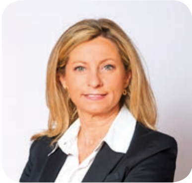
Elena Jiménez de Andrade Astorqui Presidenta del Consejo General de los Colegios de Mediadores de Seguros

Des del passat dia 7 de març, data de les eleccions al Consejo General, una nova comissió permanent va assumir la direcció del màxim òrgan col·legial. En aquest sentit em sento especialment satisfeta perquè hi hem arribat tots units per la il·lusió de contribuir al nostre Mejor Consejo. Aquest va ser el lema triat per a la nostra campanya i així ho estem traslladant.