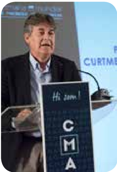
>> Presentació del curtmetratge "Hollywood, there we are!" (Una professió de cine)