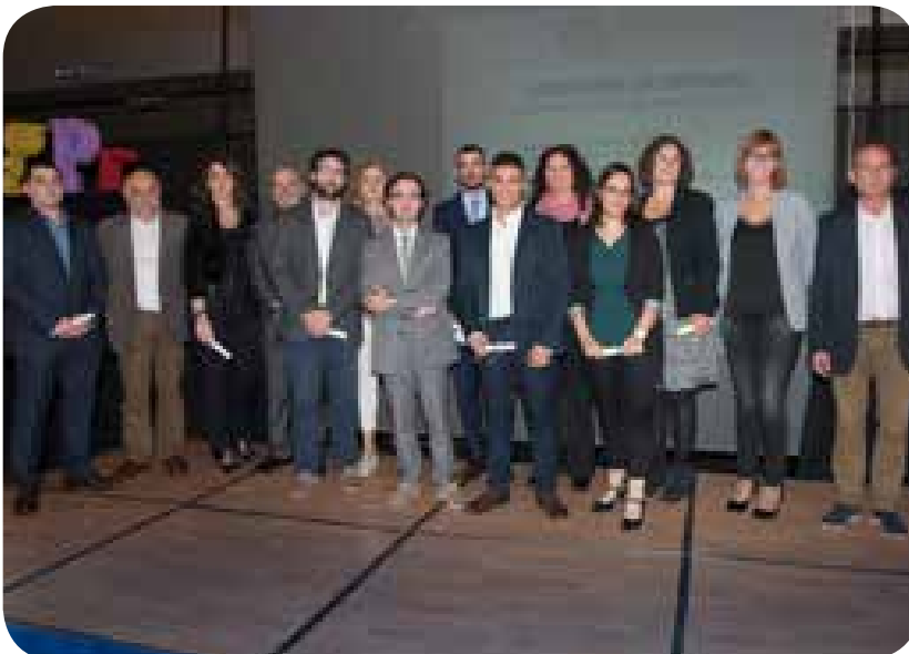
>> Lliurament de diplomes als alumnes del Curs Superior d'Assegurances 2016-17

presència del mediator d'assegurances a la gran pantalla. La presentació d'aquest curtmetratge, produït pel mateix col·legi, va anar a càrrec de Guillem Terribas, president del Col·lectiu de Crítics de Cinema de Girona.