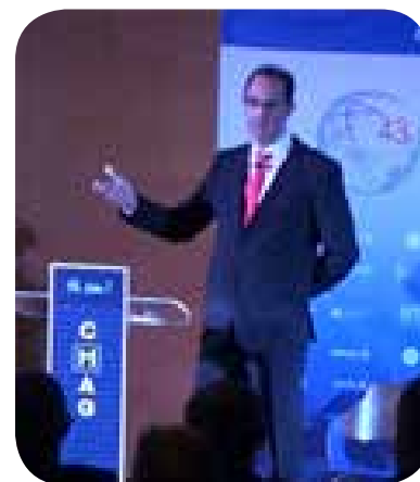
>> Acte tècnic de la 43a Setmana Mundial

Com evolucionarà el ram d'autos? Canviarà molt aquesta assegurança tan tradicional en un futur pròxim?, foren algunes de les qüestions que es van tractar en la conferència i posterior col·loqui.