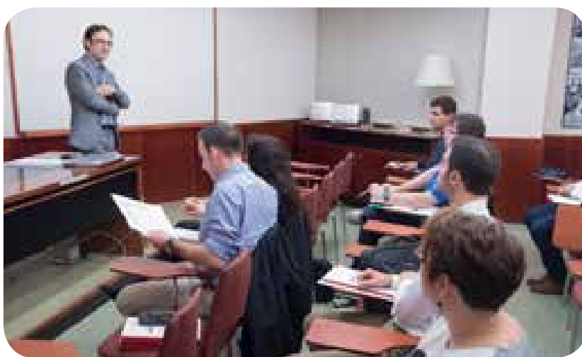
>> Inauguració del Curs Superior d'Assegurances 2017-2018