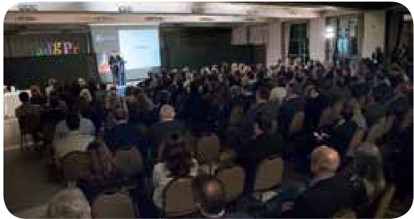
>> Aspecte general de l'acte institucional de la 43a Setmana Mundial del Mediator d'Assegurances

A continuació, es van lliurar els diplomes als alumnes del Curs Superior d'Assegurances 2016-2017, i es va fer un homenatge als mediadors veterans.