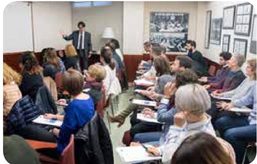
>> Aspecte general de l'aula durant el curs del mes de novembre

Així, una quarantena d'alumnes, en un curs plantejat com un taller d'entrenament personal amb els participants, van poder assolir objectius com diferenciar el que és important del que és urgent, fixar prioritats en la gestió del temps professional i personal, planificar amb eficàcia o optimitzar l'ús d'eines de gestió del temps.