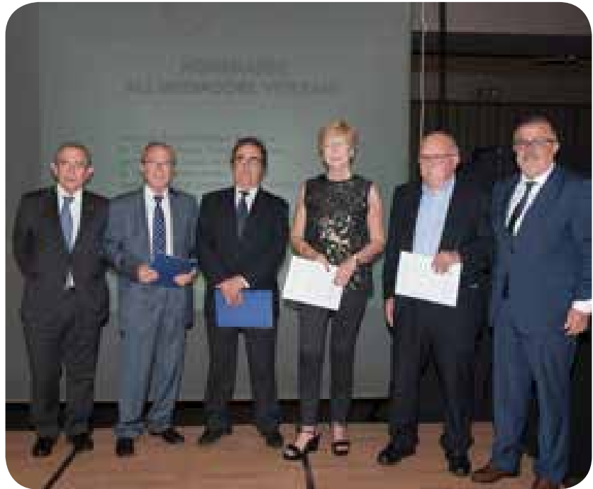
>> Homenatge als mediadors veterans

La Setmana Mundial es converteix, cada any, en un punt de trobada on es donen cita els professionals del sector assegurador procedents de diferents punts de Catalunya. És una setmana que ajuda a transmetre a la societat la imatge de servei i professionalitat del mediador d'assegurances. Un lloc d'intercanvi de pensaments, opinions professionals, personals i, en tot cas, un lloc per conèixer-se una mica millor, mediadors, asseguradores, perits, i representants de la societat civil gironina i del món empresarial.