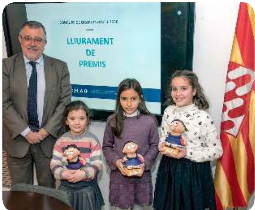
>> Guanyadores del concurs de dibuix infantil de Nadal 2018