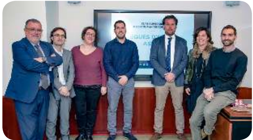
>> Beques d'estudi ASEFA als alumnes del CS 2017-2018