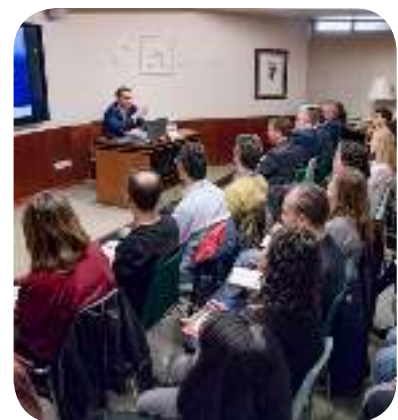
>> Moment de la conferència sobre l'EIAC

impulsor de l'EIAC, on es va parlar dels avantatges que comporta l'estandardització de sistemes de connectivitat entre asseguradores i corredors: estalvi, fiabilitat, eficiència i competitivitat.