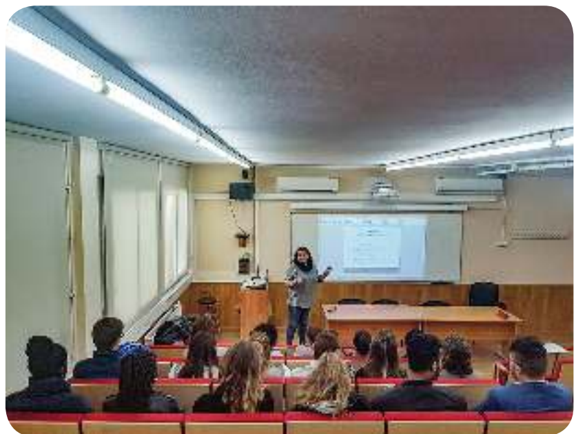
>> Xerrada informativa a l'IES Serrallarga, de Blanes

Des de d'aquí volem felicitar l'INS Serrallarga per aquesta iniciativa alhora que els agràim que hagin pensat en nosaltres per prendre-hi part.