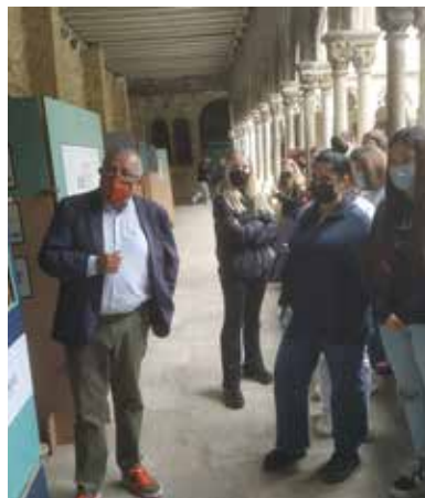
>> Alumnes visitant l'exposició

Aquest any 2021, trencant com el 21 d'octubre va tenir lloc la inauguració al Claustre Sant Domènec de la Universitat de Girona, de l'exposició "40 anys de campanyes publicitàries del CMAG (1981-2021)". La mostra es va poder visitar fins el 5 de novembre.