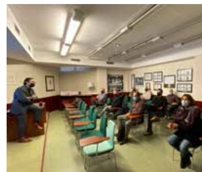
>> Reunió del claustre de professors del Curs Nivell 1

S'hi va comentar el calendari de classes i les novetats que implica la nova fórmula així com es van estudiar els continguts, plataforma en línia i la resta d'aspectes relacionats amb el nou curs.