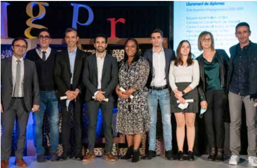
>> Alumnes del CS 2020-2021

A continuació, va tenir lloc el lliurament de diplomes als alumnes de el Curs Superior d'Assegurances 2020-2021, l'homenatge als mediadors veterans, el reconeixement als 50 anys de col·legiació, a més del lliurament del Premi Sol, premi de caràcter anual, que distingeix a l'entitat, organisme o institució nacional o internacional que ha destacat per la seva tasca d'enfortiment i defensa de la figura del medi-