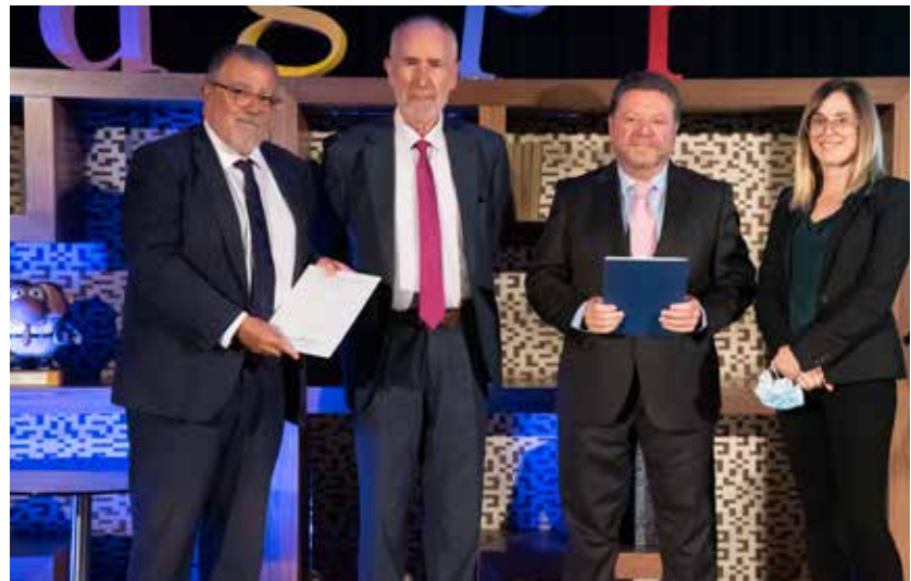
>> Homenatge als mediadors veterans