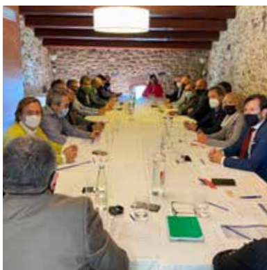
>> Moment de la Trobada amb les Entitats col·laboradores 2021

La jornada va consistir en una reunió i un dinar de treball, a la