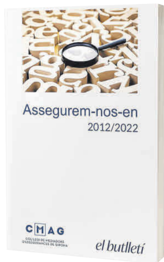
La portada del llibre CMAG