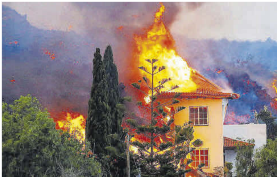
Una casa de La Palma engolida per les flames provinents de la lava del volcà.