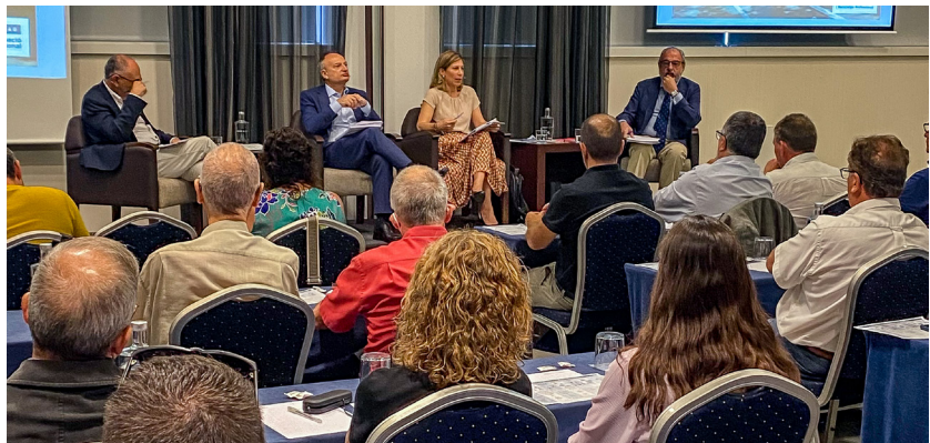
>> Aspecte de la jornada sobre VMP i vehicles sense assegurança

El principal problema de cara a la ciutadania-víctimes si no hi ha assegurança obligatòria com la que existeix per als vehicles de motor és que el nivell de protecció de les víctimes d'automòbils, camions, motos, etc. seria diferent i superior al nivell de protecció dels