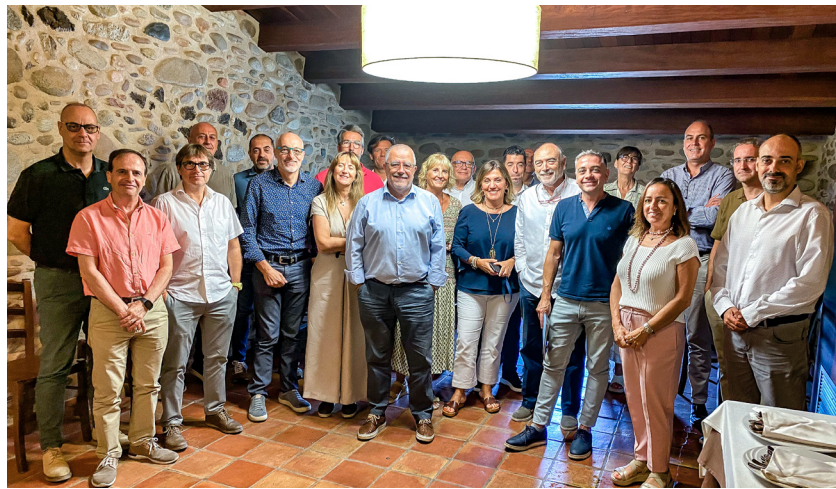
>> Assistents a la Trobada CMAG – Entitats col·laboradores 2022

En aquest acte es van comentar criteris i actuacions, cercant fórmules per millorar les relacions mediadors-entitats, intercanvi-