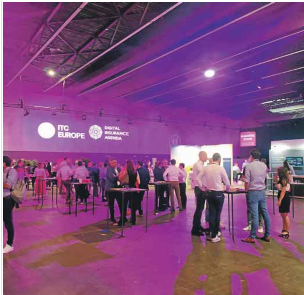
Convenció del sector de l'assegurança, aquest any a Catalunya.

Alguns experts apunten el sector financer, i particularment les inversions, com un dels riscos més difícils d'assegurar, sobretot quan es tracta d'inversions a l'estranger. Però, per increïble que pugui semblar, els mediadors d'assegurances estan acostumats a buscar solucions a mida per a totes aquelles casuístiques personals, materials i de serveis que es puguin platejar. De fet, hi ha companyies que s'han especialitzat en casos a mida. Això dificulta tenir una cartera de primes, però garanteix un servei personalitzat que, sovint, dona més garanties a la persona, empresa o col·lectiu que el contracta.