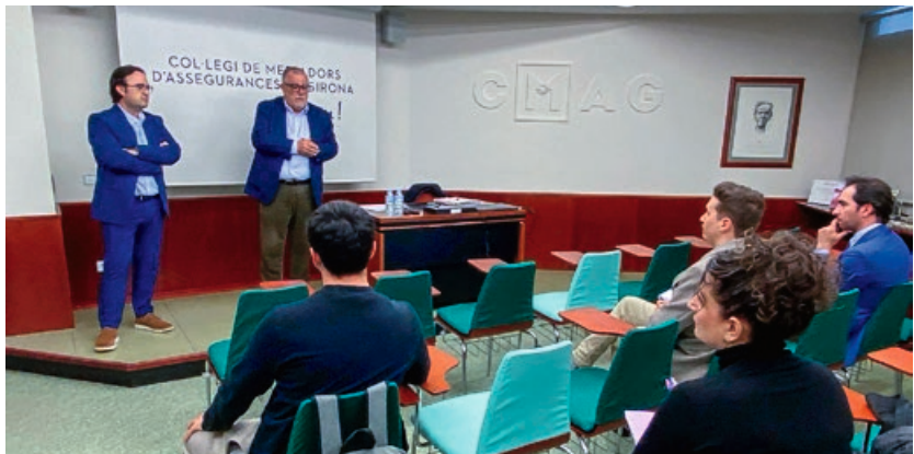
>> Moment de la inauguració del Curs Nivell 1 - 2024

Aquest curs 2024, que compta amb 7 alumnes matriculats,