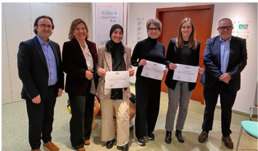
>> Beques d'estudi ASEFA 2023